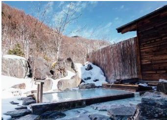
開放的な露天風呂