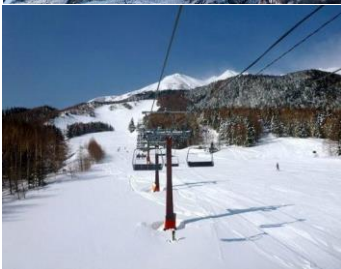
ふっかふかの パウダースノー!